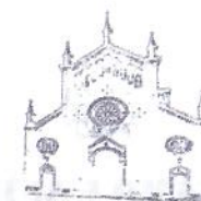
PARROCCHIA SAN. GERMANO VESCOVO