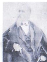
FONDAZIONE GROSSI - FRANZINI ONLUS

Nel 2012 ha fondato "EDUCREA", un'associazione culturale no profit che opera in ambito scolastico, familiare ed educativo, di cui è Presidente. Dal 2011 conduce la rubrica radiofonica "Consulenza familiare" sull' emittente Radio Maria.