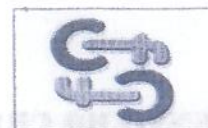
comunità familiari cooperativa sociale